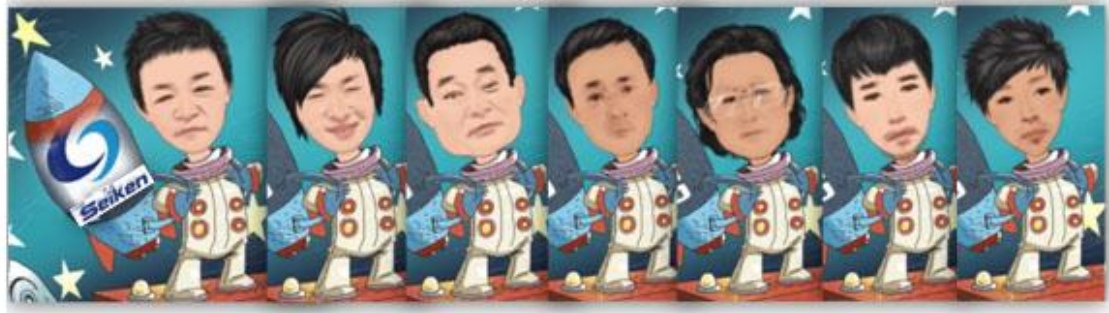
免許保持者全員での集合写真